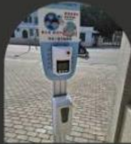
STEP2. 酒精消毒 & 量額溫