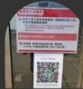
STEP3. 掃QR CODE, 即可進校。