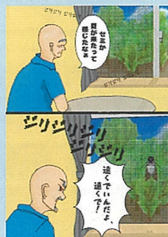
1頁漫畫【高中組】(Distance・距離) 作品名:夏天的距離感 筆名:NATATEKOKO