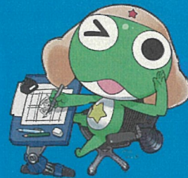
「吉崎敦彦」氏より 提供角色 Keroro軍曹